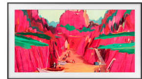
The Frame Pro 2025